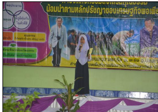
กิจกรรมसानฝันเด็กน้อยสู่ MC ณ เวทีระดับโรงเรียน