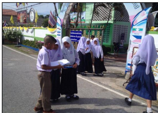
กระบวนการเรียนรู้ที่หลากหลาย เช่น Outdoor Activity