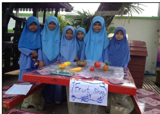
เรียนรู้โดยการลงมือปฏิบัติจริง