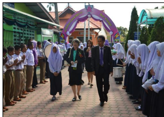
Anubanyarang Junior Guide ทำหน้าที่ต้อนรับผู้มาเยือน