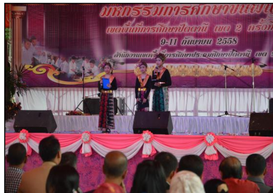
กิจกรรมसानฝันเด็กน้อยสู่ MC ณ เวทีระดับเขตพื้นที่การศึกษา