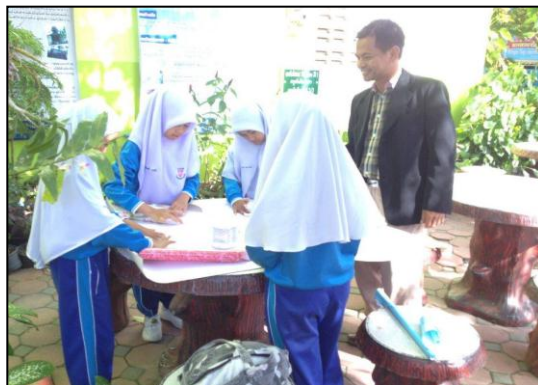
การสอนแบบบูรณาการ